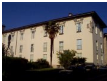
NOVARA - Via Aldo Moro 1 segreteria@apimpresa.it